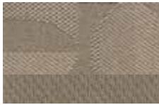
Light Pebble Cloth Standard on ZX4 S and SE, and ZXW SE Tela Light Pebble Estandar en ZX4 S y SE, y ZXW SE