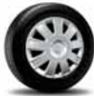
15" Steel Wheel with 9-Spoke Appearance Cover Standard on ZX4 S

De acero de 15" con cubierta embellecedora de 9 brazos Estandar en ZX4 S