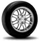
15" Multi-Spoke Aluminum Wheel Standard on ZXW Optional on ZX4

De acero de 15" con cubierta embellecedora de 7 brazos Estandar en ZX4 SE