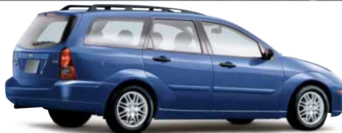
SES Wagon in French Blue Metallic

Este sistema, lo más avanzado en tecnología de sensores de ocupantes, detecta si debe activarse o no la bolsa de aire del pasajero. Mide la tensión del cinturón de seguridad y el peso del pasajero, detectando si el asiento del pasajero está ocupado o no, y si el pasajero es grande o pequeño. Luego, procede a activar o desactivar la bolsa de aire de manera correspondiente, a fin de proporcionar el nivel más exacto de protección.