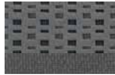
Light Flint Cloth Standard on ZX4 SES and ZXW SES Tela Light Flint Estandar en ZX4 SES y ZXW SES