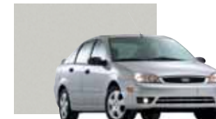
CD Silver Metallic