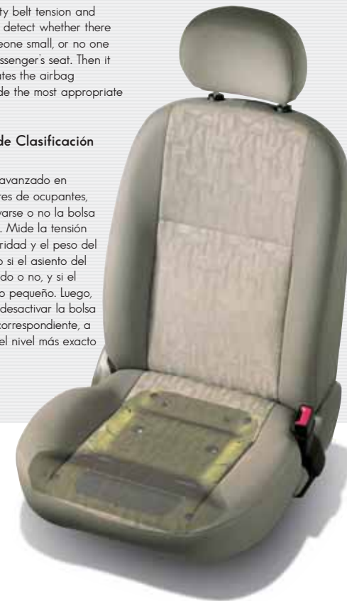
SES Wagon color French Blue Metallic