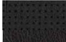
Charcoal Preferred Suede® Trim Optional on ZX4 ST Detalles de Gamuza Charcoal Preferred Suede® Opcional en ZX4 ST