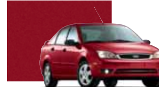
Sangria Red Metallic