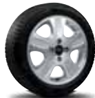
16" 5-Spoke Machined-Aluminum Wheel Standard on ZX4 ST

De aluminio de 15" de brazos múltiples Estandar en ZXW Opcional en ZX4