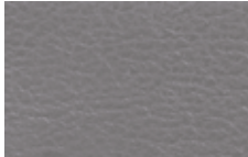
Light Flint Leather Trim Optional on ZX4 SES and ZXW SES Detalles de Cuero Light Flint Opcional en ZX4 SES y ZXW SES