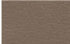
Light Pebble Leather Trim Optional on ZX4 SES and ZXW SES Detalles de Cuero Light Pebble Opcional en ZX4 SES y ZXW SES