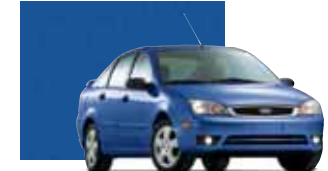
French Blue Metallic