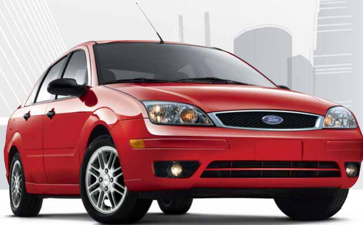
Focus SE in Infra-Red with optional SE Sport Group and multi-spoke wheels

Zippering down a curvaceous strip of blacktop in a new 2005 Ford Focus is an exhilarating experience, one that can't easily be translated into words. And that's just the way we like it. Truly a driver's car, Focus is designed to spice up even your everyday journeys. Ever wonder what it's like to hug a road? Find out behind the wheel of a new Focus. The crisp feel of its power rack-and-pinion steering, mixed with the taut, responsive nature of its outstanding suspension, deliver excitement beyond your wildest imagination.