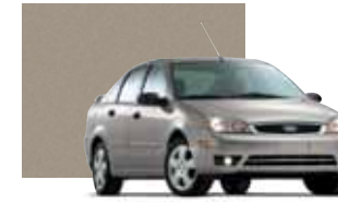
Arizona Beige Metallic