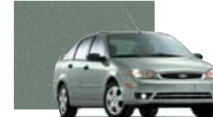
Light Tundra Metallic