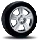
16" 5-Spoke Aluminum Wheel Standard on ZX4 SES

De acero de 15" con cubierta embellecedora de 9 brazos Estandar en ZX4 S