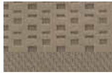
Light Pebble Cloth Standard on ZX4 SES and ZXW SES Tela Light Pebble Estandar en ZX4 SES y ZXW SES