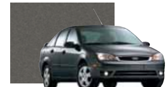
Liquid Grey Metallic