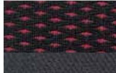
Charcoal Cloth Standard on ZX4 ST Tela Charcoal Estandar en ZX4 ST