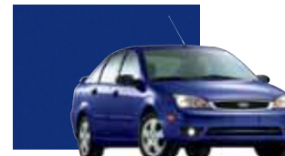
Sonic Blue Metallic