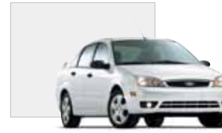
Cloud 9 White